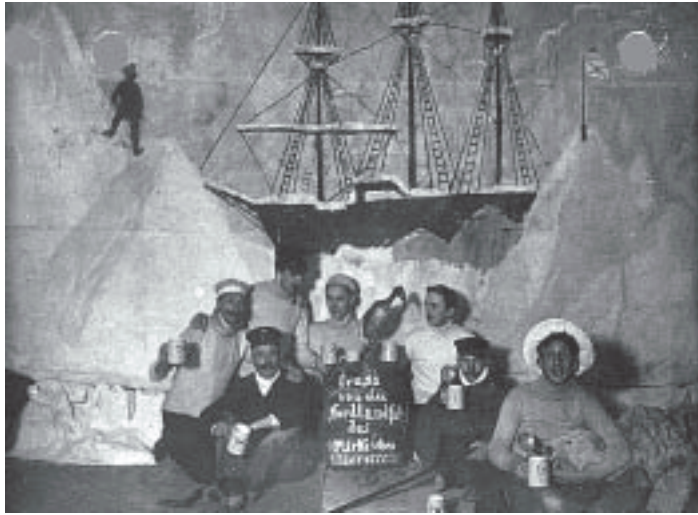
Ballfest „Fahrt nach Nordkap“ 1907

„weiße Beinkleid“ musste sein. Die Mitglieder des Märkische Rudervereins in einheitlicher Vereinskleidung ergaben sicher ein imposantes Bild. Feste in so einem schönen, gepflegten Rahmen waren bestimmt sehr stimmungsvoll.