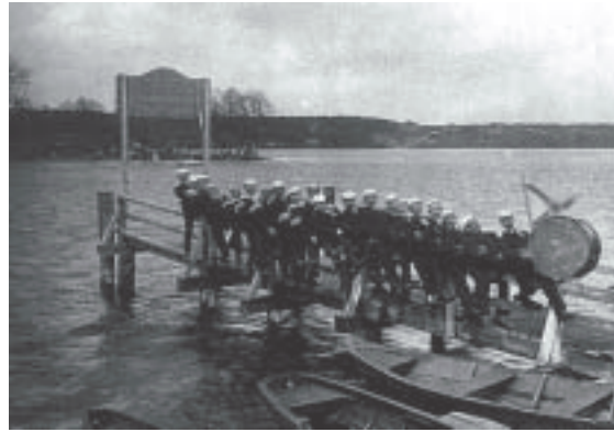
Die Märker am ersten Osterfeiertag in Fangschleuse (1924)

bewegung in den späteren Jahren mit Weltwirtschaftskrise, Krieg und allerlei gesellschaftspolitischen Ereignissen machte sich offenbar in der „Schöpfungslust“ bemerkbar. Unabhängig davon wurde aber Musik und Gesang im Verein weiterhin gepflegt. Dafür sorgten der vereinseigene Chor und eine Orchestervereinigung.