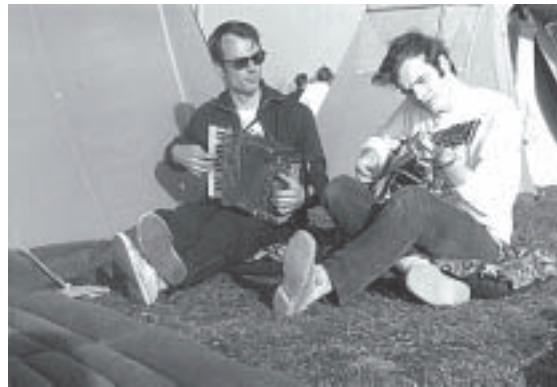
Im Zeltlager auf Alsen/Hardeshoi (1962)

Zusammenfassend soll hier erwähnt werden, dass in den 100 Jahren des Märkischen Rudervereins gemäß vorliegendem Schrifttum immerhin 88 eigene Vereinslieder entstanden sind. Aber ohne in Liederbüchern „verewigt“ zu sein, dichteten die Märker noch Dutzende weiterer Lieder für die ver- schiedensten Gelegenheiten.